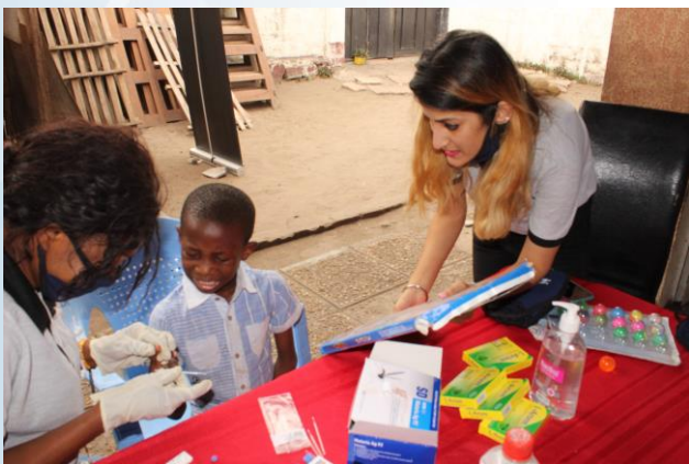
En plein dépistage

Dans la continuité de la lutte contre le paludisme qui fait toujours des morts en sur l'ensemble du continent africain en général et dans notre pays la RDC en particulier, c'est dans ce cadre pour lutter contre le paludisme que HJ Foundation a mené une campagne de dépistage gratuit du paludisme à l'orphelinat Domus Angeli dans la commune de Masina où l'on a pu dépister une vingtaine d'enfants avec le soutien de nos différents partenaires.