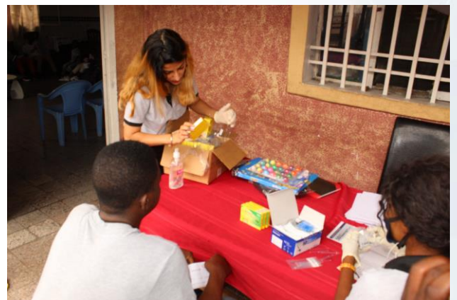
Remise des médicaments