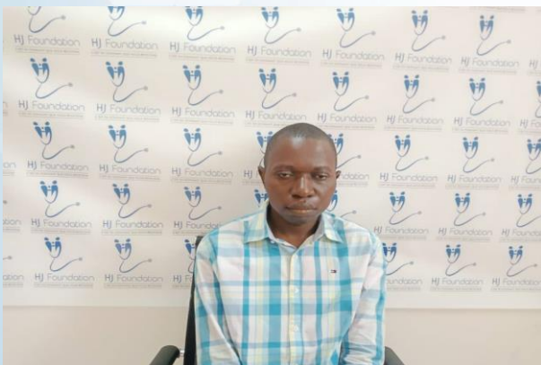
Ses mots de remerciement