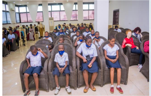
Les enfants étaient attentionnés au mot leur adressé