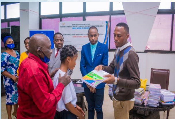
Remise des kits scolaires aux enfants