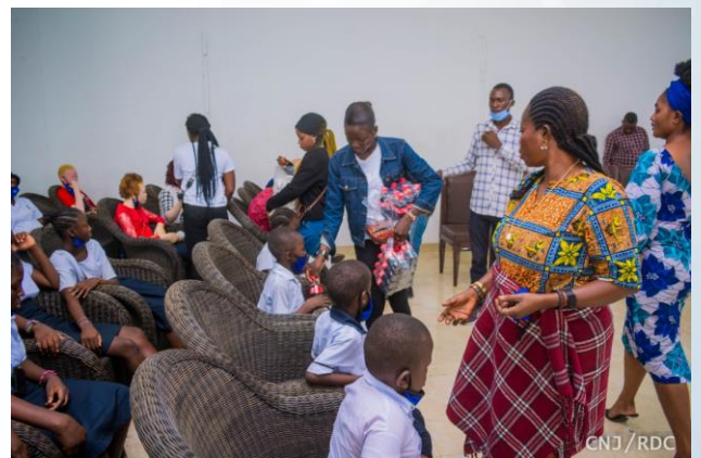
Rafraichissement des enfants à la fin de la cérémonie